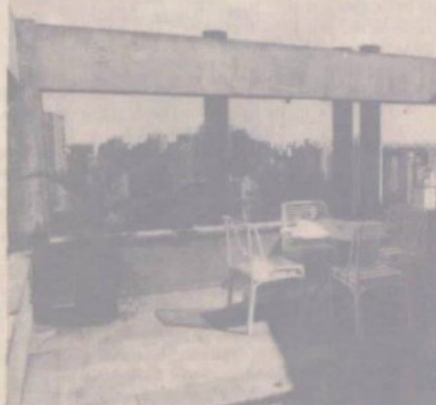
Nas coberturas, conforto.